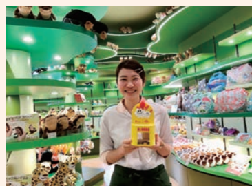
動物園入口ショップ (中央区南公園)