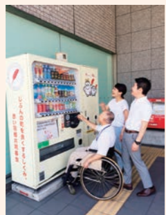
福岡市市民福祉プラザ (中央区荒戸)