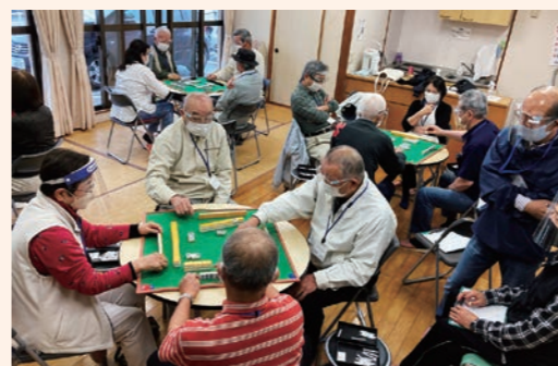
ふれあい健康麻雀(博多区那珂南校区)

○地域の福祉課題を解決する活動に取り組んでいる校区社会福祉協議会が行う、高齢者や子どもの居場所づくり、住民福祉講座等へ