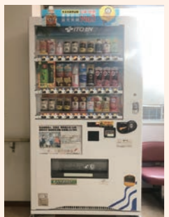
(福)天真会 博多老人ホーム (東区三苦)

清涼飲料水の売り上げの一部が募金になります。福岡市内には約30台設置いただいています。