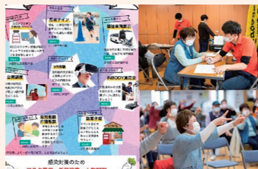
小田部ふくしの集い(早良区小田部校区)