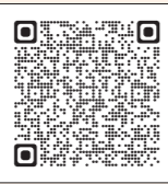
赤い羽根ありがとうマップ (協力企業・事業者編)