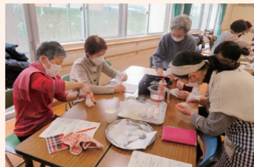
災害食作り(城南区城南校区)

○福岡市社会福祉協議会が行う、各事業等へ ・法人後見事業 ・ずーっとあんしん安らか事業 ・校区福祉のまちづくりプラン策定推進事業 ・広報紙(ふくしのまち福岡)発行事業 他