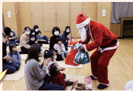
子育てサロンつくしんぼ クリスマス会 (南区東若久校区)

出前児童館「あいくる」からきていただき、絵本の読み聞かせやパネルシアターと親子ふれあい体操で楽しいクリスマス会を行いました。最後にサンタさんも登場して子どもたちにクリスマスプレゼントを配ってくれました。